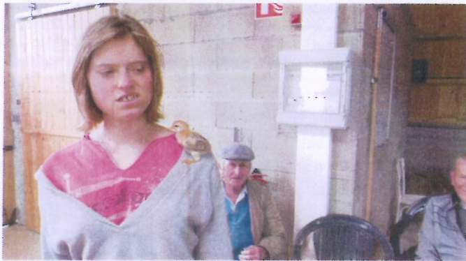
Apprivoiser un poussin