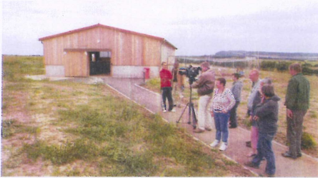
Présentation à la télé allemande