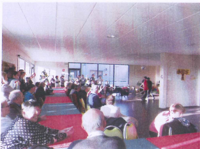
La grande salle à manger